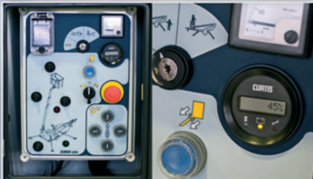
Lätthanterliga, överskådliga och informativa manöverpaneler.