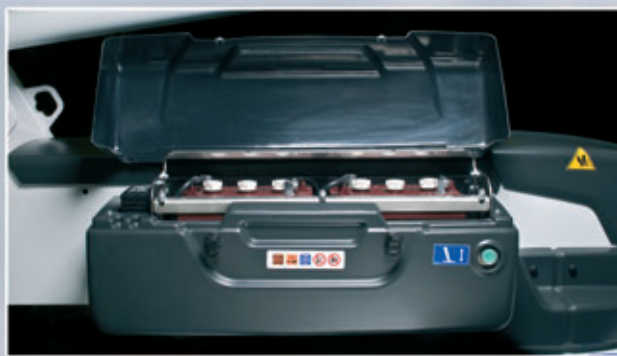
Batterier med hög kapacitet.