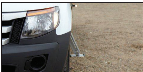
Stödben när full sidoräckvidd behövs.