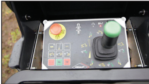
Canbus proportional manövrering av liftens samtliga rörelser.