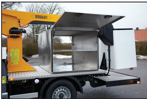
Skåp anpassade efter dina behov